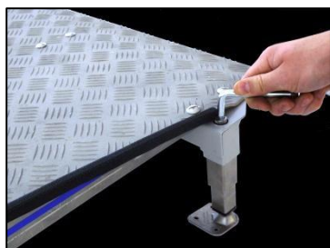
Einfache Höhenverstellung von 7.5 bis 22.5cm